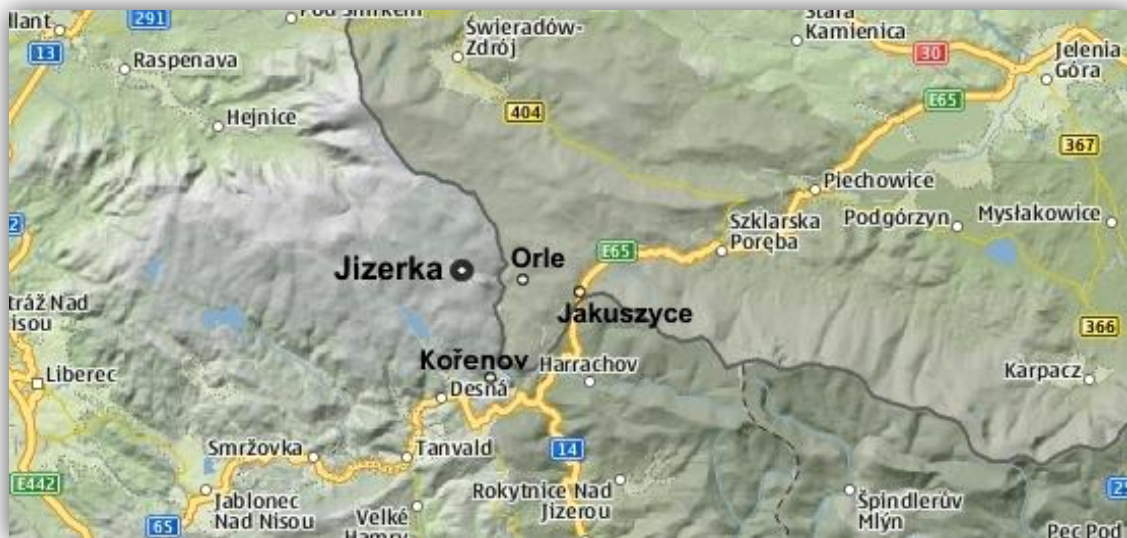
Mapa Gór Izerskich

www.izera-darksky.eu , www.astro.uni.wroc.pl/astroizery